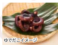
ゆでたこイメージ