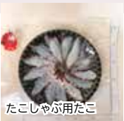
たこしゃぶ用たこ