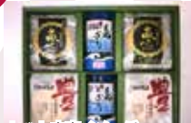
セット内容イメージ

セット内容：たこせんべい 5枚 ×2セット・海老せんべい 4枚 ×2セット・味付けのり ×2個 取れたてのたこ・海老をふんだんに使った贅沢で風味豊かなせんべいと、人気の島のりがセットになった商品です。ご自宅用にも、贈答用としてもおすすめです。