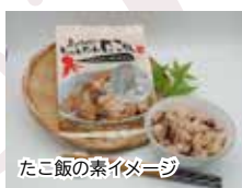
たこ飯の素イメージ

セット内容：しらす 300g・ちりめん 250g・たこ飯の素 2~3合用・ゆでたこ約 500g チベット高原湖塩と国産塩のみで炊きあげたしらす、簡単・本格的にたこ飯が味わえるキット、丸ごと茹でたインパクト大のゆでたこなど、日間賀島特製の贅沢なセット。