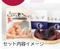
セット内容イメージ