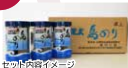
セット内容イメージ

セット内容：味付けのり ×12個 日間賀島のお土産の中でも人気が高い、一度食べはじめると止まらないパリパリ食感の味付けのり。たっぷり味わえる12個セットでの販売です。絶妙の甘辛い味付けでご飯のお供にも、そのままおやつにもどうぞ。